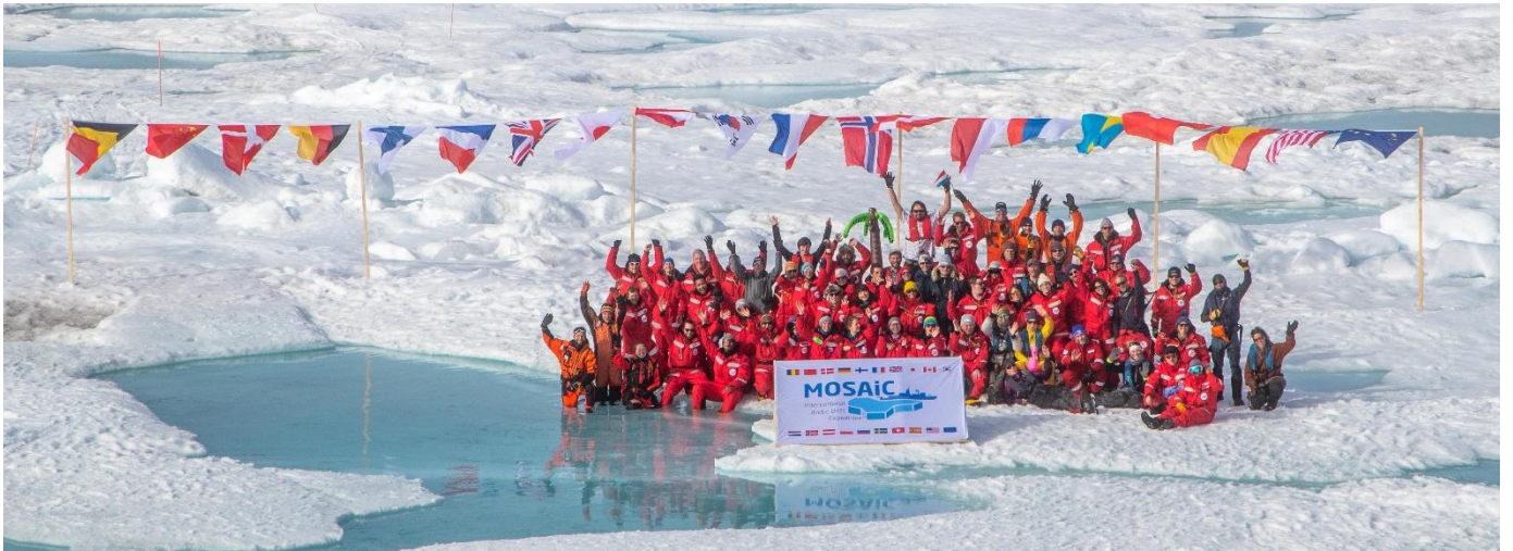
Encadré 1 : La coopération scientifique germano-russe dans l'Arctique 3

l'Ukraine 2 , la militarisation accrue de l'Arctique et l'érosion potentielle de l'ordre international fondé sur des règles.